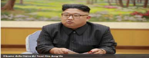
Il leader della Corea del Nord Kim Jong Un

LETTORE | Espresso | LA STAMPA | Il Sole 24 Ore | L'Espresso | ANSA | AGF